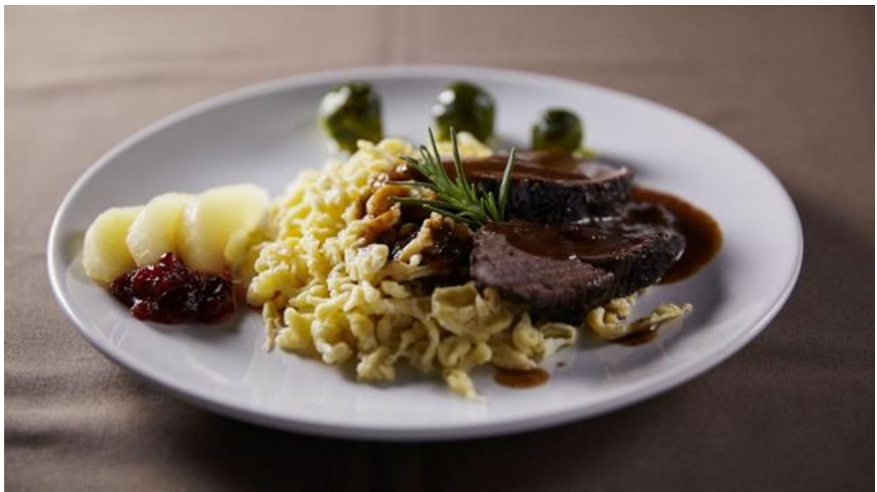
Hirschbraten mit Knöpfle